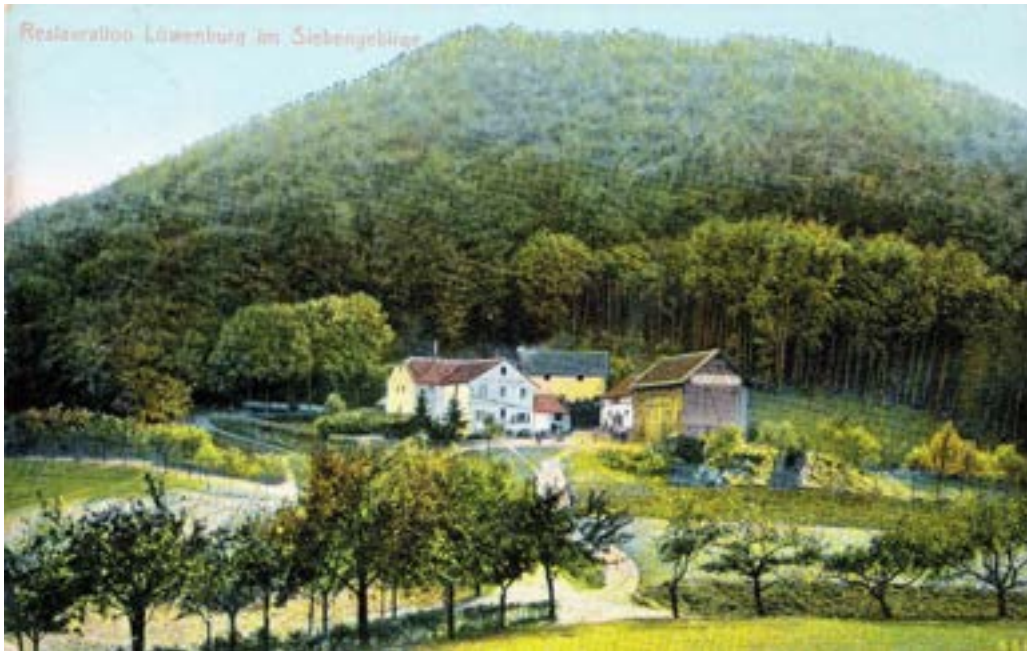
Löwenburger Hof um 1907

Die „vortreffliche Küche und Keller des Löwenburgerhofes“ xxix genoss im Mai 1892 „die Königin von Schweden nebst Gefolge“, auf 6 Maultieren angereist, zum zweiten Mal. Die Königin trat den Rückweg per Wagen an. xx Berichtet wird, dass sie „anlässlich ihrer Kuraufenthalte in Bad Honnef oft zum Löwenburger Hof kam und sich dort gern mit dem Förster Ruwet vom Stadtwald Honnef unterhielt“. xxi